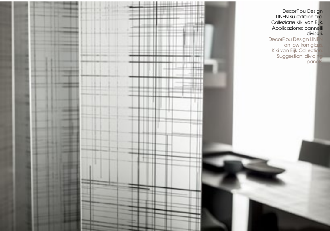
DecorFlou Design LINEN su extrachiaro. Collezioni Kiki van Eijk. Applicazione: pannelli divisori. DecorFlou Design LINEN on low iron glass. Kiki van Eijk Collection. Suggestion: dividing panels.