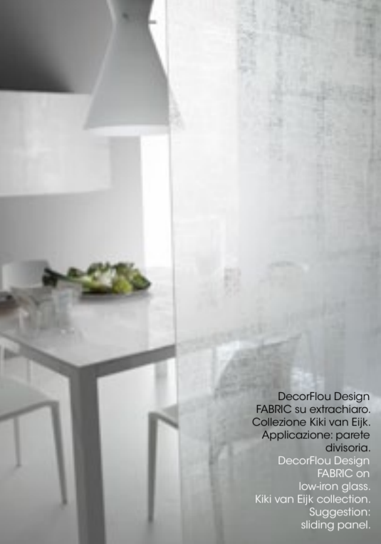
DecorFlou Design FABRIC su extrachiaro. Collezioni Kiki van Eijk. Applicazione: parete divisoria. DecorFlou Design FABRIC on low-iron glass. Kiki van Eijk collection. Suggestion: sliding panel.