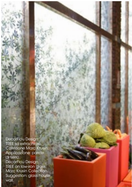
DecorFlou Design TREE on low-iron glass. Marc Krusin Collection. Suggestion: glass house wall.