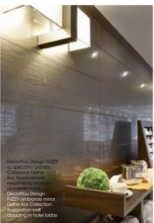
DecorFlou Design FUZZY su specchio bronzo. Collezioni Defne Koz. Applicazione: rivestimento muro in ambiente hotel. DecorFlou Design FUZZY on bronze mirror. Defne Koz Collection. Suggestion: wall cladding in hotel lobby.