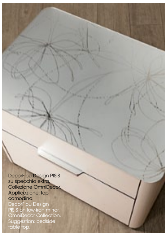
DecorFlou Design PISIS su specchio extra. Collezioni OmniDecor. Applicazione: top comodino. DecorFlou Design PISIS on low-iron mirror. OmniDecor Collection. Suggestion: bedside table top.